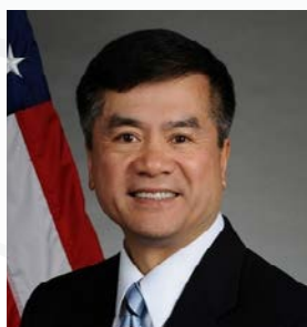
骆家辉大使 美国驻中国大使

金立群现任中国国际金融有限公司董事长，同时担任主权财富基金国际论坛主席，中国外交政策咨询委员会 委员，外交学会理事等职务。二十多年来，特别是 1997 年亚洲金融危机之后，金立群先生一直积极从事 国际经济事务。他参与很多双边和多边经济和金融论坛的工作，如中美联合经济 委员会、中英财经对话、APEC 财长会议等、东盟加 3 和 20 国集团等。金立群先生曾担任中国货币政策委员会委员。