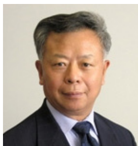
金立群 中国国际金融有限公司 董事长

金立群现任中国国际金融有限公司董事长，同时担任主权财富基金国际论坛主席，中国外交政策咨询委员会 委员，外交学会理事等职务。二十多年来，特别是 1997 年亚洲金融危机之后，金立群先生一直积极从事 国际经济事务。他参与很多双边和多边经济和金融论坛的工作，如中美联合经济 委员会、中英财经对话、APEC 财长会议等、东盟加 3 和 20 国集团等。金立群先生曾担任中国货币政策委员会委员。